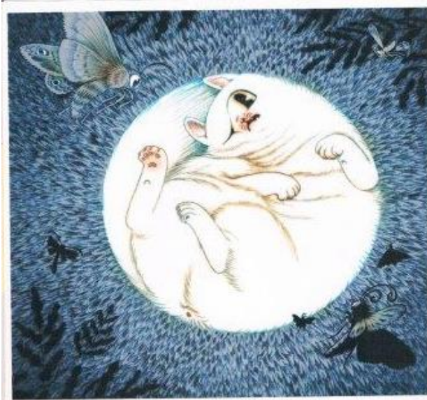
איור 4 - לילה בלי ירח, גפן וקרת, 2006, איור: פולונסקי, עמוד 6

ממול." / "ירח-שמריח, בלי טעם, בלי ריח." / ילל החתול והתמתח – / "כל מה שהוא לא מעדן או כיבוד / מצדי שילך לאבוד." / פהק החתול פהוק רחב / וחזר לעצם את עיניו." (עמוד 7). החזרה על גרגרנותו של החתול מדגישה "מגמה שאותה רצה המחבר להעדיף על האחרות" (גונן, 2000, 62), ולפיכך נוצר קשר חד-משמעי בין שומן לזללנות. מהטקסט גם עולה שהחתול הוא עצל ומעדיף לישון, וגם כשהוא לומד שהירח אבד, הוא אינו נרעש ואינו נרתם לעזרתה של זוהר, אלא מפקח וחוזר לישון. שיוך התנהגות זו לדמות שמנה, מתכתב עם תפישה רווחת לפיה בעלי גוף שמן נוטים לעצלנות ונרתעים מפעילות. החתול הוא אנוכי, אינו מתחשב ומתעלם מהזולת, והממד החזותי משכיל להעצים התרשמות זו (איור 4): החתול מאויר ככדור מושלם שדבר אינו חודר אותו, והחרקים שמקיפים אותו