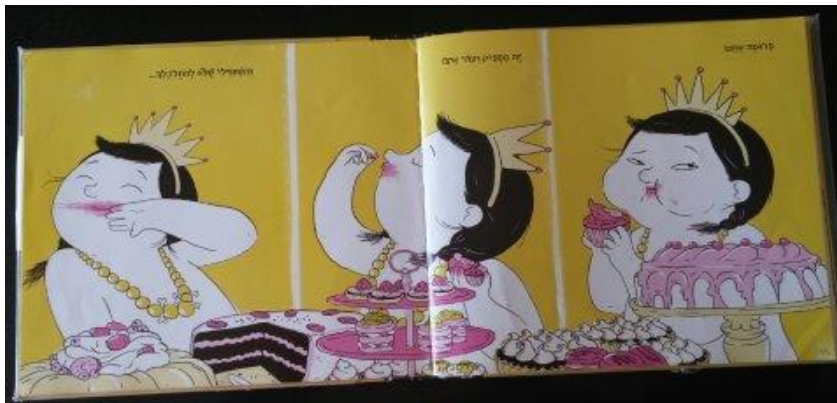
איור 2 - סיפור אחרי השינה, סמיט, 2014, איור: צרפתי, עמודים 13-14

פעולת האכילה של דידי, ומוטב לומר זלילה, היא אחד משלושה ביטויים של מתיחת הגבול